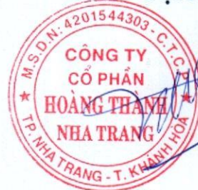
Nguyễn Xuân Thùy